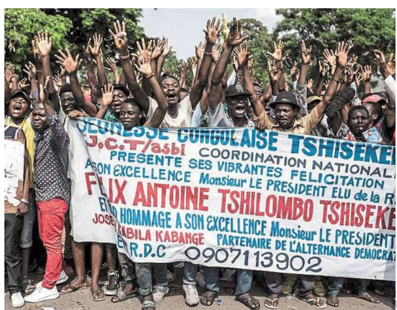
Des partisans de Félix Tshisekedi avant la décision de la Cour constitutionnelle, samedi, à Kinshasa.

Malgré les fortes suspicions de fraude, la Cour constitutionnelle a validé dans la nuit de samedi à dimanche les résultats de la présidentielle du 30 décembre et la victoire de Félix Tshisekedi. Elle inflige au passage un camouflet à l'Union africaine et au président rwandais Paul Ka-