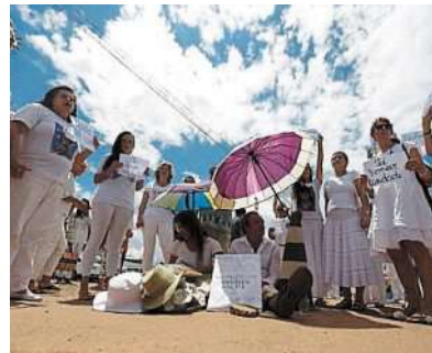
Des pèlerins rassemblés à Abadiânia.